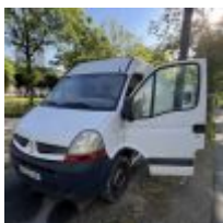
Lot n° 9 RENAULT MASTER