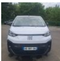
Lot n° 5 FIAT E-SCUDO