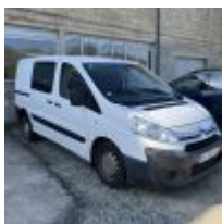
Lot n° 7 CITROEN JUMPY