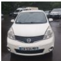
Lot n° 16 NISSAN NOTE 1.5 DCI