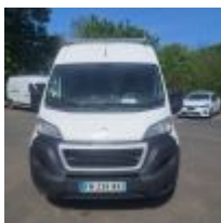
Lot n° 8 PEUGEOT BOXER 2.2 HDI