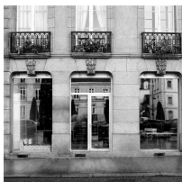
Lot n° 17 CITROEN C4 1.6 HDI