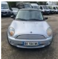
Lot n° 15 MINI COOPER