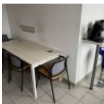
Table plateau stratifié façon bois 4 Chaises visiteur Tabouret haut Micro-ondes KING D'HOME Cafetière PHILIPS Cafetière SENSEO Bouilloire électrique Mise à prix : 80€

Bureau piètement tubulaire chrome 2 Fauteuils skaï noir Armoire stratifié façon bois Mise à prix : 70€