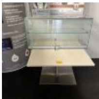
Table basse plateau stratifié façon bois Petite vitrine Mise à prix : 20€

Photocopieur HP L3U51A numéro de série CNDVK2P0KV Mise à prix : 80€