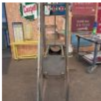
Table élévatrice (Test ok) Mise à prix : 300€