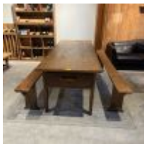
Table de ferme en massif Paire de bancs Tapis Mise à prix : 80€

5 Tonneaux 6 Chaises hautes 6 Tabourets métal (type industriel) Mise à prix : 200€